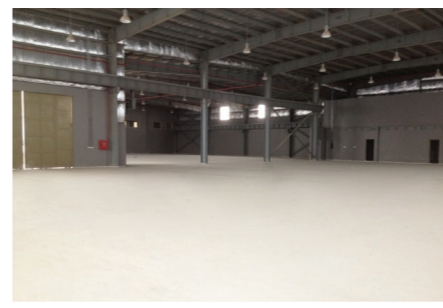
Судостроительная верфь STX-OSV, г. Тулча, Румыния