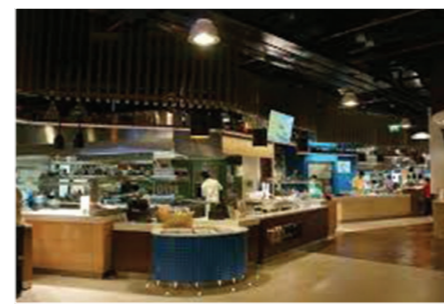
Ресторан Eatoria в торговом молле Gate, г. Доха, Катар