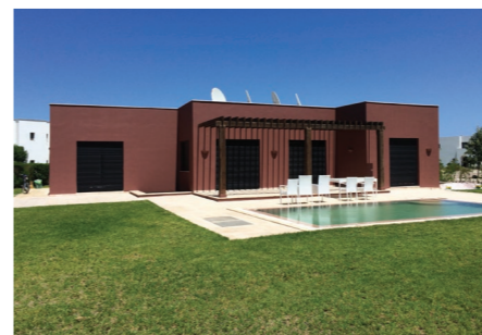
Проект в сфере жилой недвижимости класс люкс в г. Тунисе, Тунисская Республика