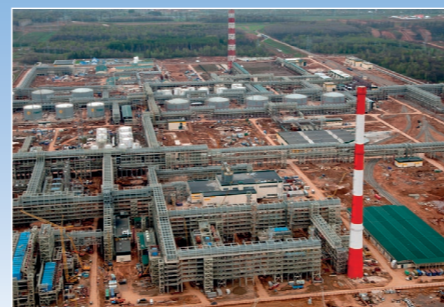
Нефтеперерабатывающий завод Татнефть, г. Казань, Татарстан