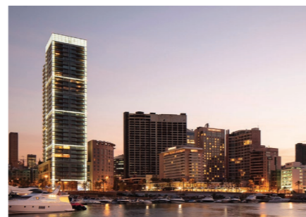
Платиновая башня, г. Бейрут, Ливан