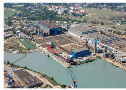
Судостроительная верфь STX-OSV, г. Тулча, Румыния